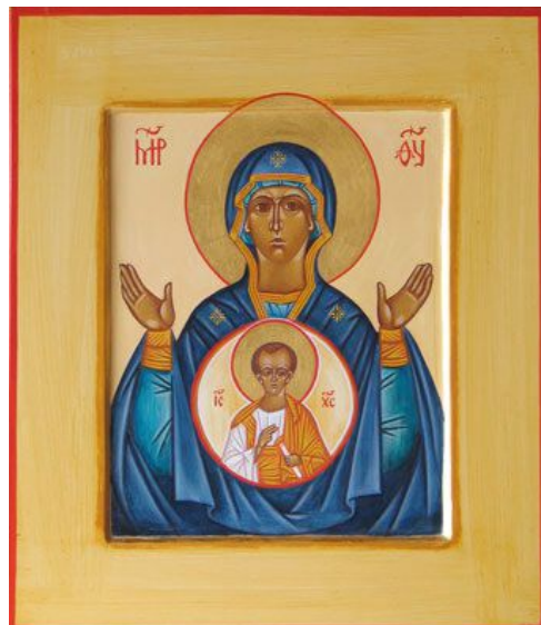
Icône de la vierge « le large espace du Verbe » ou « Platytera »

5-A ta droite se tient le Seigneur : Il brise les rois au jour de sa colère.